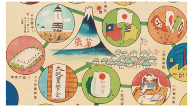
上がりと現実のギャップ 最後のコマは「大政翼賛会」。その右上には「万歳」と書かれた富士山と日の丸の旗を立てた軍姿が見えます。一方で万歳どころではない暮らしがありました。